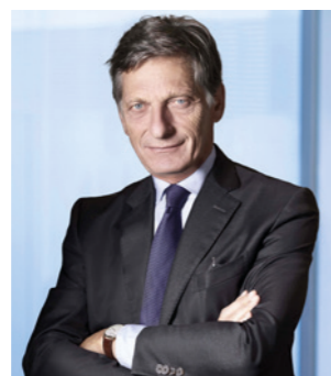
NICOLAS DE TAVERNOST Président du Directoire du Groupe M6